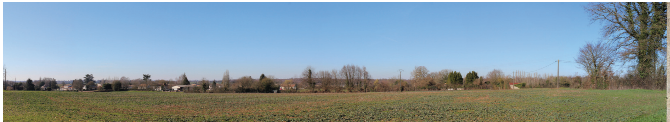
Vue panoramique de l'état initial (angle de vue 120°)