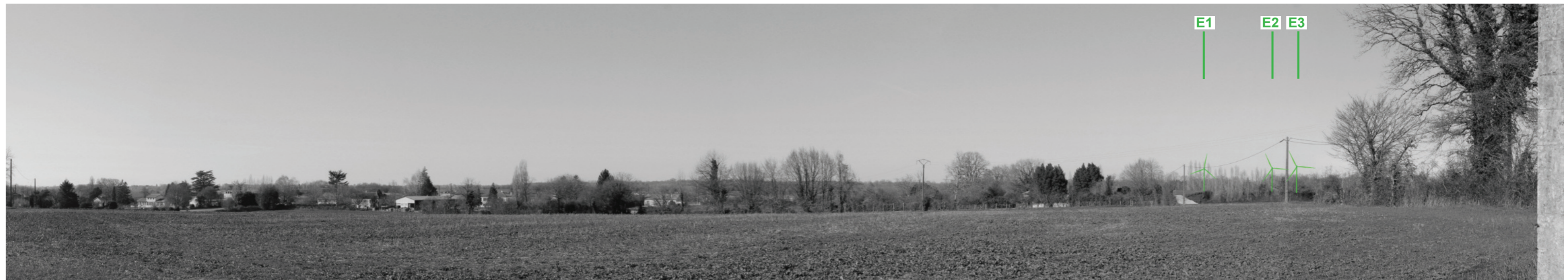
Vue panoramique noir et blanc avec esquisse du projet (angle de vue 120°)

Coordonnées Lambert II étendu : 414427 / 2136849 Date et heure de la prise de vue : 15/02/2019 à 16:23 Focale : 52 mm, équivalent 24 x 36 Azimut vue réaliste : 352° Angle visuel du parc : 7,1° Eolienne la plus proche : E3, à 3 030 m